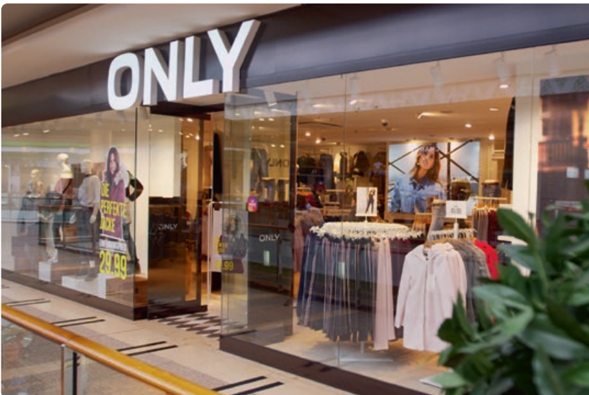
Una de las 500 sucursales conectadas a Internet con el FRITZ!Box

Productos FRITZ!: • 500 FRITZ!Box • 20 FRITZ!Box LTE • Varios FRITZ!Fon