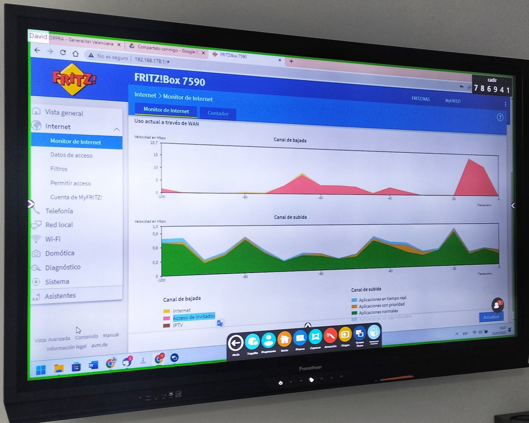
Pizarra digital con datos del Sistema operativo de FRITZIOS de las aulas de CADIR